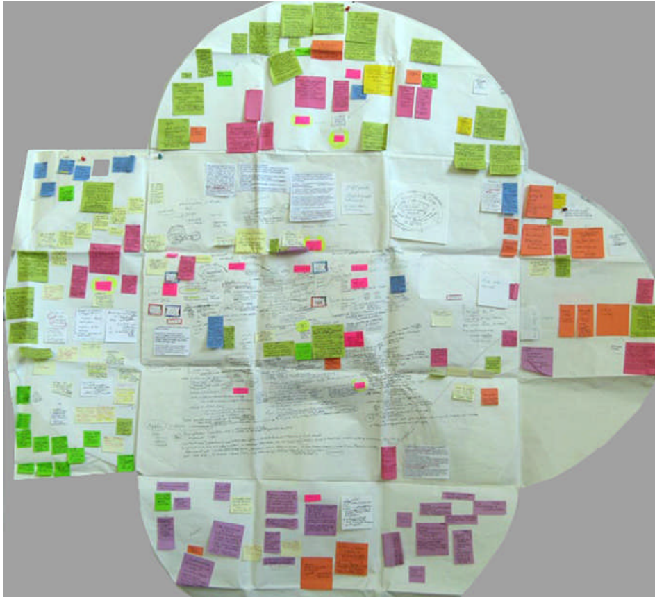
Figure 2 : Paysage d'idées en cours de développement

Ces opérations permettent d'étudier les relations entre les diverses composantes de ma pratique. Les post-it se regroupent peu à peu par affinité. Une perspective prend forme. À un moment donné, des thèmes majeurs s'imposent. Je les écris alors sur des post-it aux couleurs plus éclatantes, pour les mettre en valeur par rapport aux autres. Peu à peu, il me semble que la représentation parvient à un certain niveau de saturation, que le paysage s'apaise, se stabilise. Je veux dire par là que tout prend sens et que le portrait que j'arrive à donner de ma pratique artistique me semble juste.